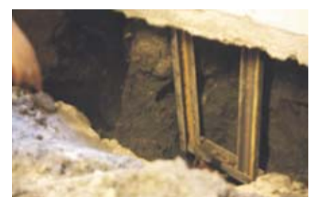
... og på toppen anbringes denne stål-jarvert. Bagefter støbes det hele ind i beton, og således levede de lykkeligt til deres dages ende.