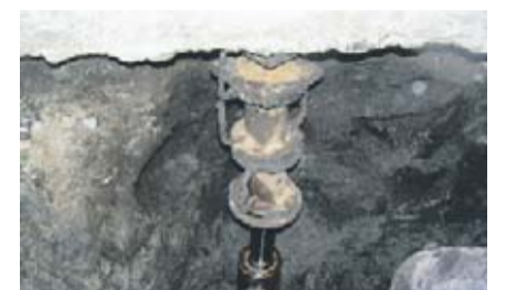
Man graver ud under væggen og planter et kraftigt jernrør, som presses ned i jorden med hydraulik. Røret forlænges - meter efter meter ...