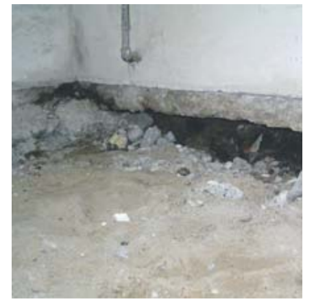
... men nede i kælderen åbenbares den skrækkelige sandhed: Huset er frit i luften svævende!