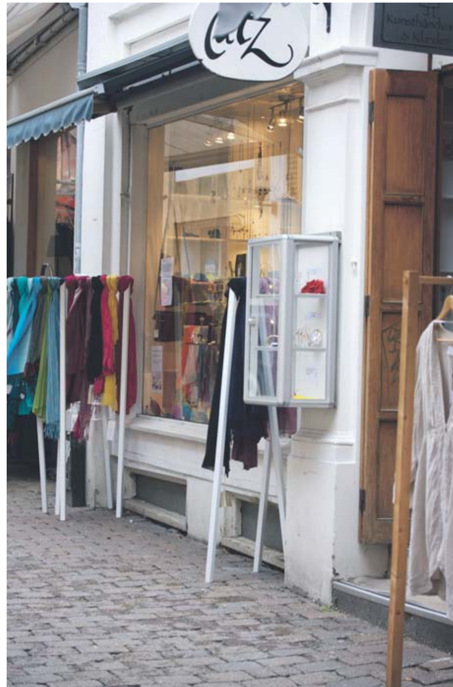
Alt ånder fred og idyl i smykkebutikken Catz i Svendborg ...